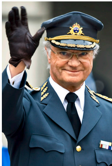
Carl Gustav: Bleibt ein König, der ins Bordell geht, moralische Instanz?