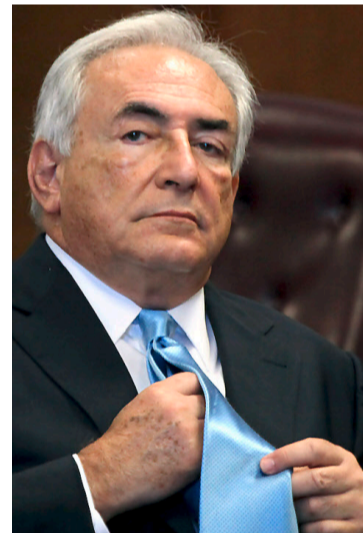
Dominique Strauss-Kahn: Statt Karrierehöhepunkt folgte ein tiefer Fall.