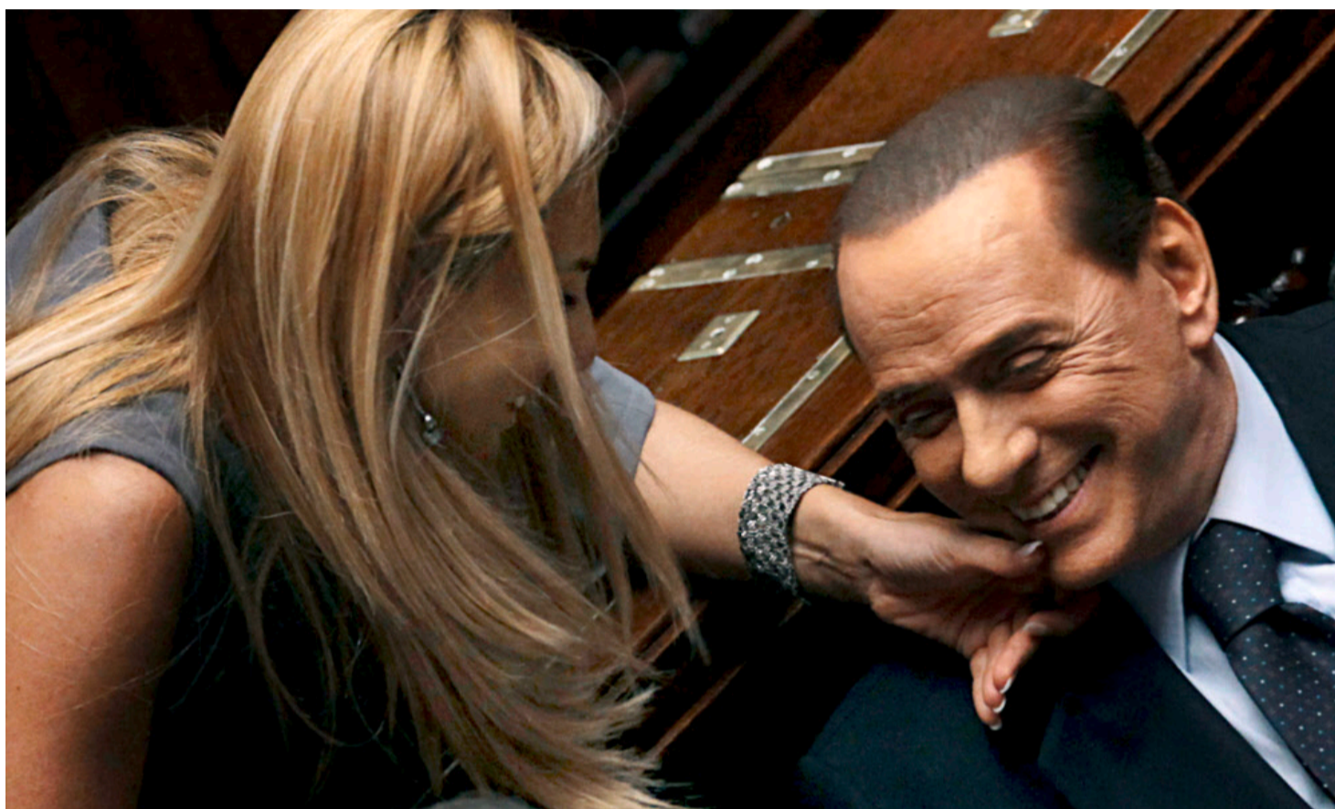
Silvio Berlusconi: Wegen seiner Eskapaden ist seine Ehe am Ende, und die politische Karriere steht am Scheideweg.

Männer wissen, dass es im Geschäftsleben knallharte Spielregeln gibt, und sie halten sich daran. Jene, die Karriere machen wollen, planen diese haargenau. Geht es ums Geschäft, ist für sie nichts verschieb- und verhandelbar. Anders im privaten Bereich: Die Männer machen sich wenig Gedanken dazu. Und wenn, dann halten sie alles für verhandelbar. Männer sind es gewohnt, dass eine Frau das Privatleben managt – sei es nun die Mutter oder die Lebenspartnerin. Es ist erstaunlich: Als Jungeselle ist der Mann sehr selbstständig. Doch kaum lebt er mit einer Frau zusammen, gibt er die Selbstständigkeit ab: Nun ist es die Frau, die sich um den Haushalt, um den emotionalen und den sozialen Bereich kümmert.