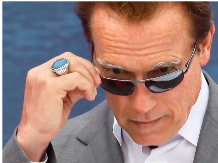
Arnold Schwarzenegger: Er betrog die Ehefrau unter dem gemeinsamen Dach. Weshalb hat er sich nicht früher überlegt, ob das gut gehen kann?